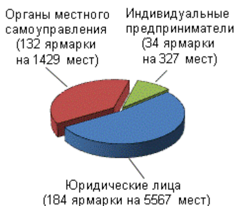
Распределение ярмарок по организаторам