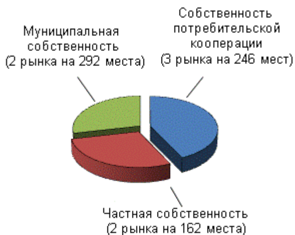
Распределение числа рынков по форме собственности